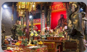
วัดบิกโท